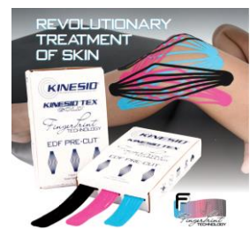
【肌能系指紋款預裁貼布】一盒