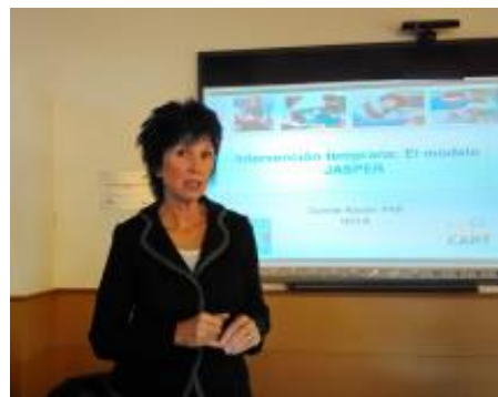
本課程為全英文授課，現場有中文摘要翻譯。